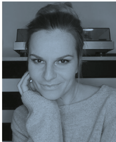
Iva Pazderková